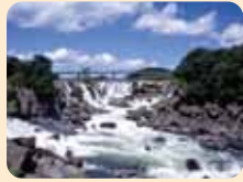
曾木瀑布 瀑布宽度达210米，被誉为东洋的尼亚加拉