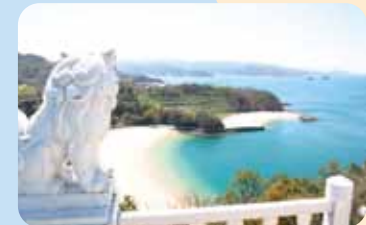
御立岬公园海水浴场 (田浦御立岬公园)