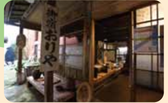
种田山火住过的地方 (日奈久温泉)